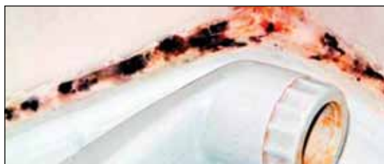
Hier muss dringend saniert werden: Schimmelpilzbefall in einem Nassbereich