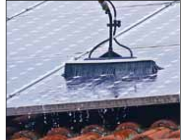
Reinigung mit Reinstwasser in der Verbindung mit moderner Technologie. So wird sehr wirtschaftlich ein optimales Ergebnis erzielt.

Mit dem Einsatz von „Reinstwasser“ wird nicht nur umweltverträglich, sondern auch effektiv und zeitsparend gearbeitet. Unter „Reinstwasser“ versteht man Wasser, das frei von jeglichen Mineralien ist. Die gereinigten Flächen trocknen dabei